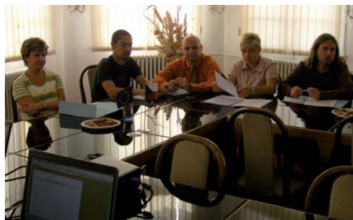
Obrázek 4: Jednání MAT v Bilíně

Cílem bylo, aby se MAT staly diskusním a plánovacím místem. Proto byly uplatňovány techniky, které rozvíjejí komunikaci a směřují tak ke stanovenému cíli. První takovou metodou byl úvodní brainstorming 6 k tématu. Ten odkryl karty a ukázal přístupy jednotlivých účastníků k řešení problémů. Výstupy z brainstormingů se staly základním podkladem pro další jednání MAT. V průběhu dalších jednání MAT byla často využívána metoda „round table“ neboli „kulaté stoly“. Jedná se o řízenou diskusi k vybraným tématům, kdy jednotliví členové týmu mají stejné možnosti a práva rozhodovat a vstupovat do diskuse.